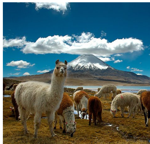
Parque nacional Lauca (precordillera de Parícuta), Reserva de la Biósfera desde 1981