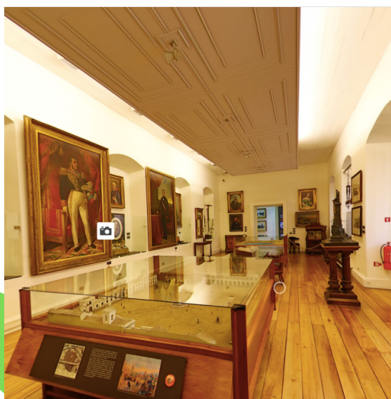
Museo Histórico Nacional Chile