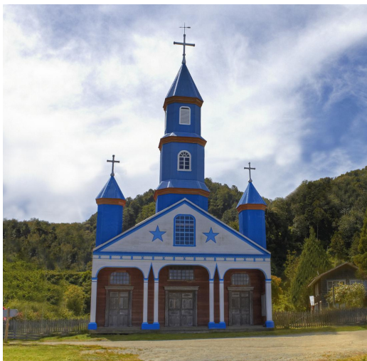
Iglesia de Senaún, Chiloé. Patrimonio de la Humanidad desde el 2000